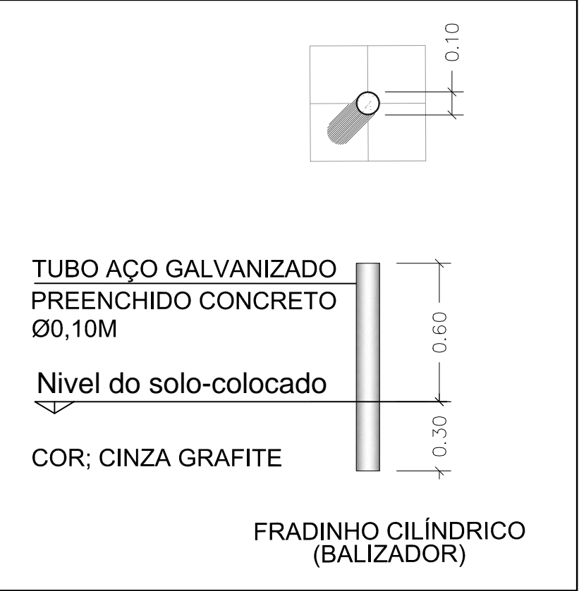
DET. FRADINHOS (BALIZADOR) Sem Escala